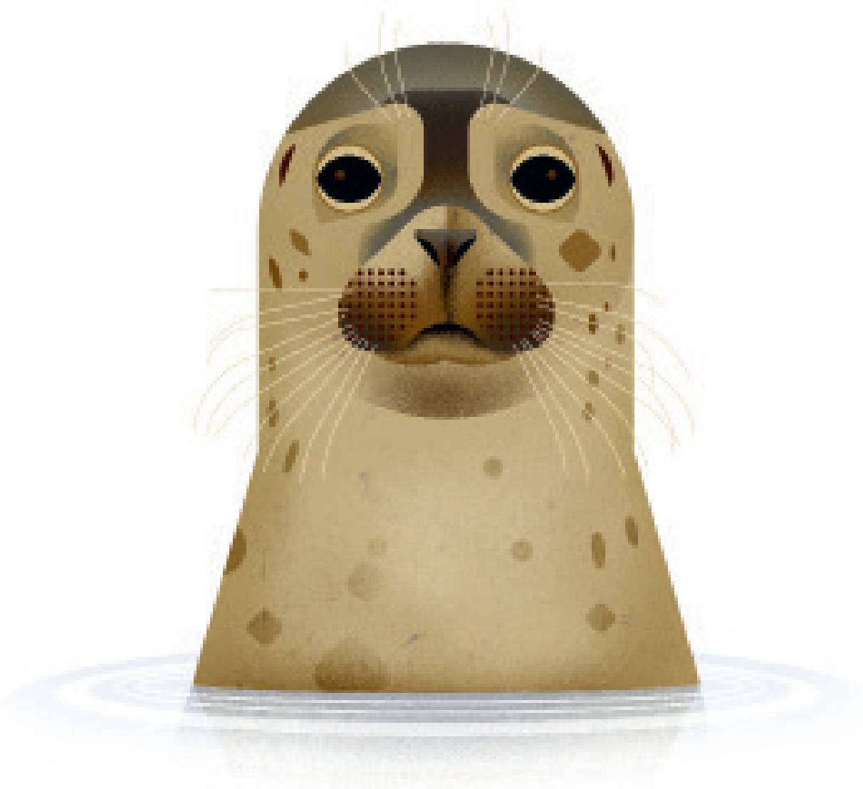
Foca moteada // Phoca vitulina